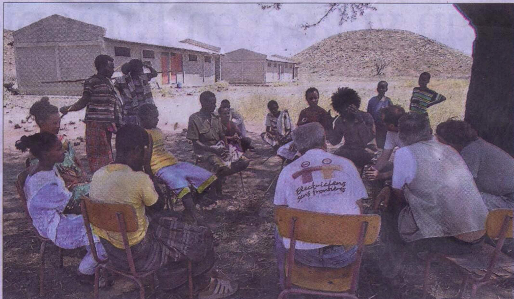
■ Première réunion sur place pour évoquer l'électrification de l'école d'Hanlé Dabi, en pays afar.