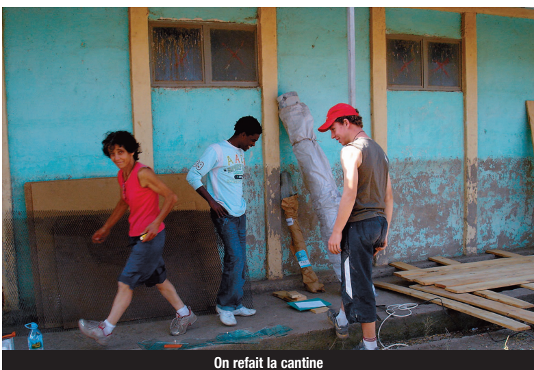
On refait la cantine