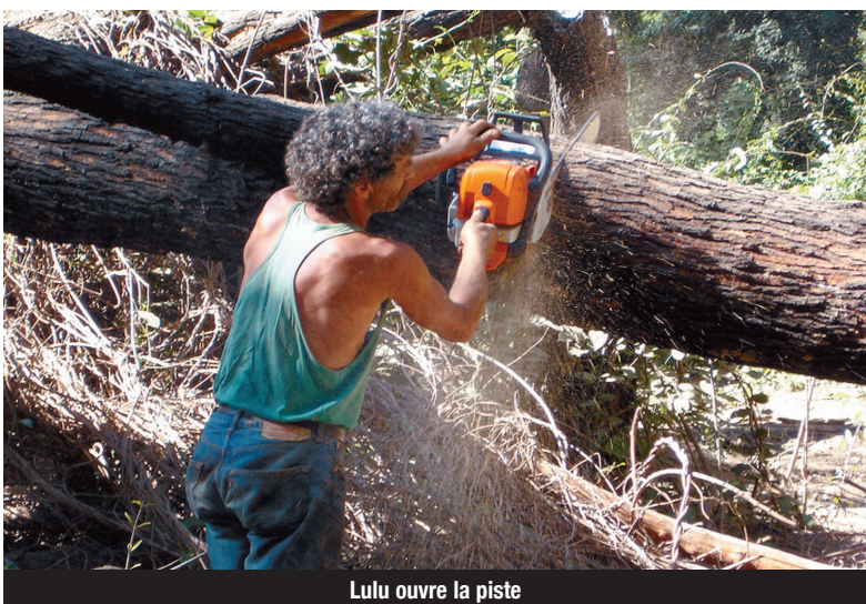
Lulu ouvre la piste

F orte de sa cinquantaine adhérents, et d'un petit noyau qui chaque année prépare avec acharnement le périple pour mener à bien une nouvelle mission, son dernier séjour s'est déroulé du 14 au 31 décembre 2008 "passionnément" ! Cette année, il s'agissait de continuer le travail commencé et d'avancer sur quatre axes : - d'abord l'apiculture : création d'une miellerie, fabrication de ruches par les artisans locaux sur un modèle "kényan", bien adapté à la région et former les villageois à cette production qui se pratiquait jusque là en récolte de miel sauvage, voici les actions réalisées lors des précédentes missions. Les habitants ont été très réceptifs car ils ont vendu cette année 8 kg de miel, rendement significatif car deux ans en arrière c'était la cueillette sauvage du miel qui se pratiquait au village !