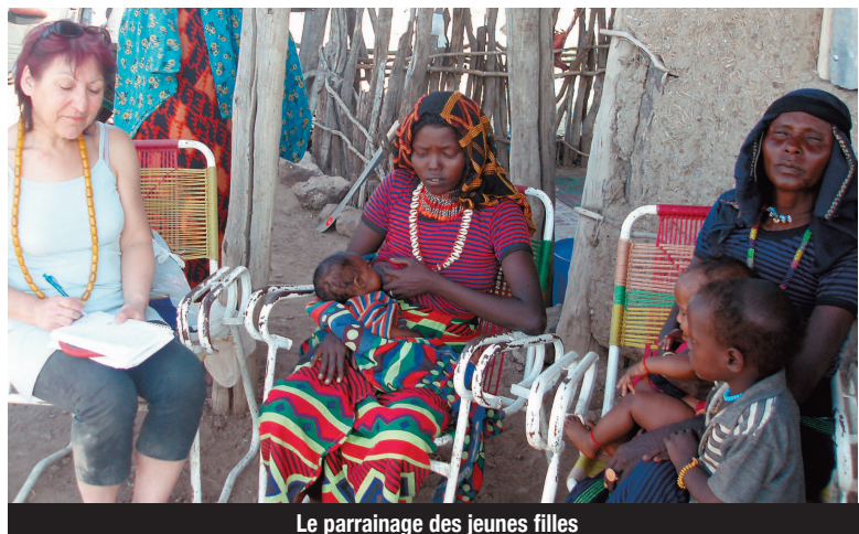
Le parrainage des jeunes filles